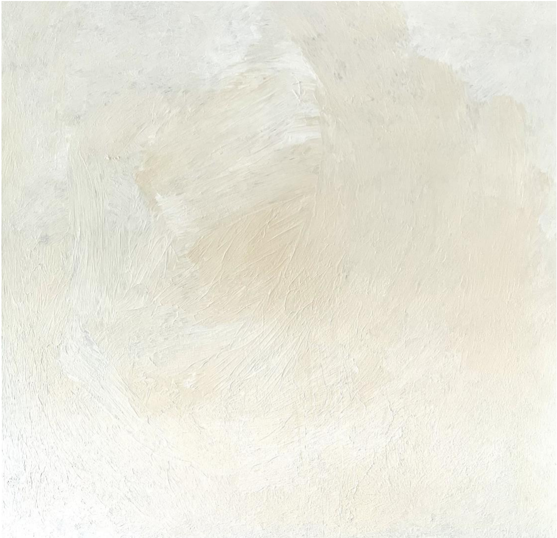
Uit de serie Vruchtbeginsel 2024— acryl op doek