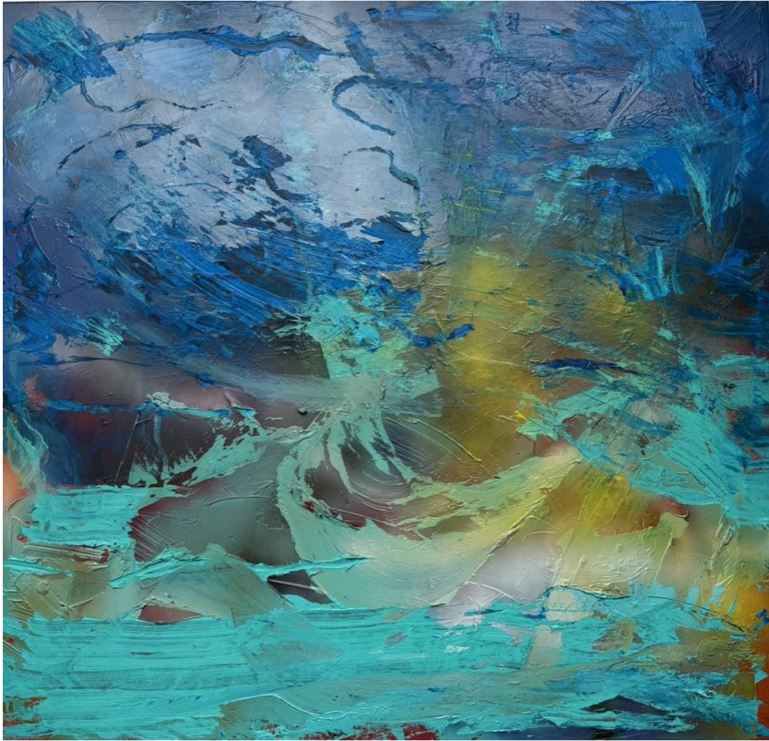
Het Tij – 2025 acryl op doek