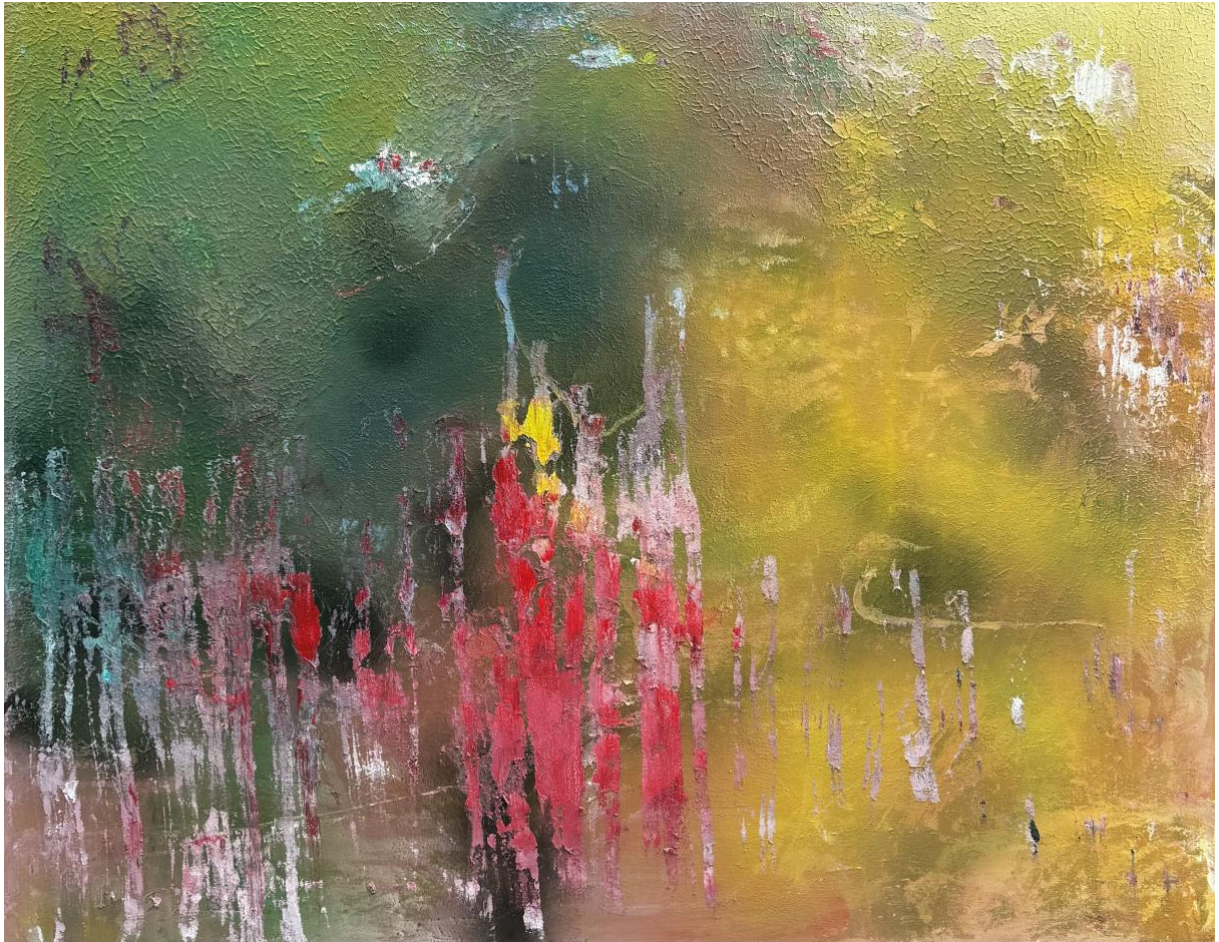
Er Is Altijd Meer - 2024 acryl op doek