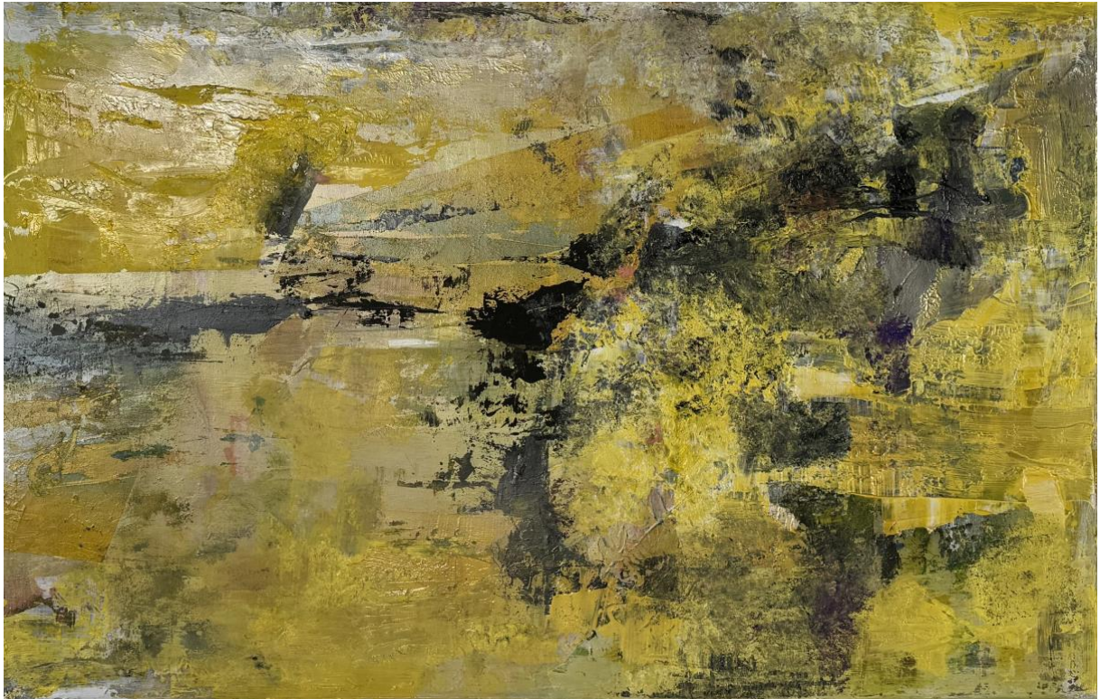
Terzijde - 2026 acryl op hout