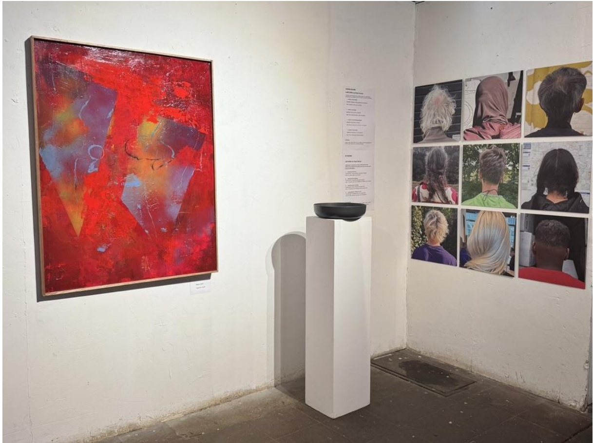
Bijeen – 2026 acryl op doek