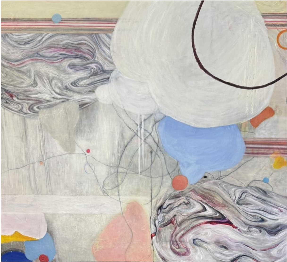
Pets – 2024 acryl en olie op doek Steven DeKetele