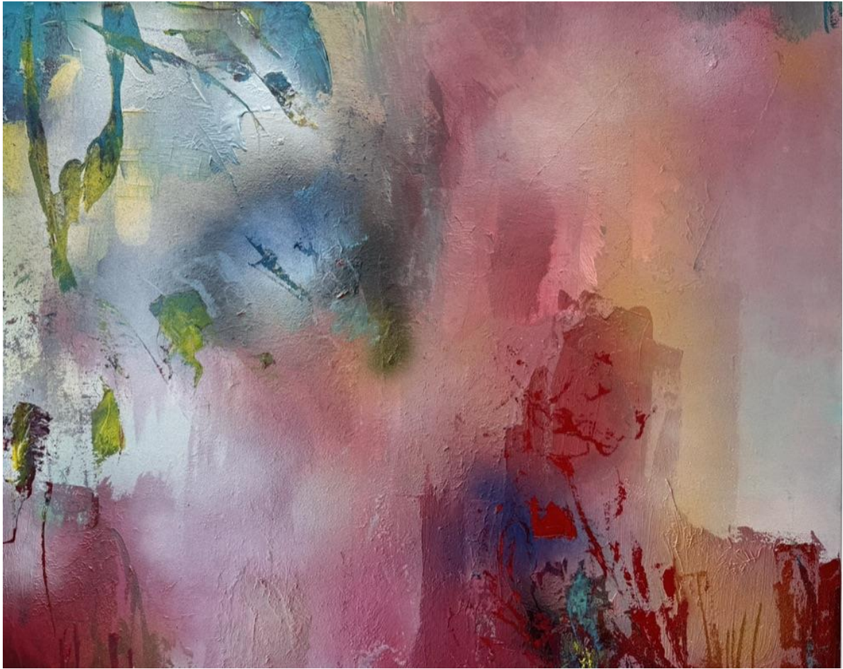
Bewegend Licht – 2024 acryl op doek