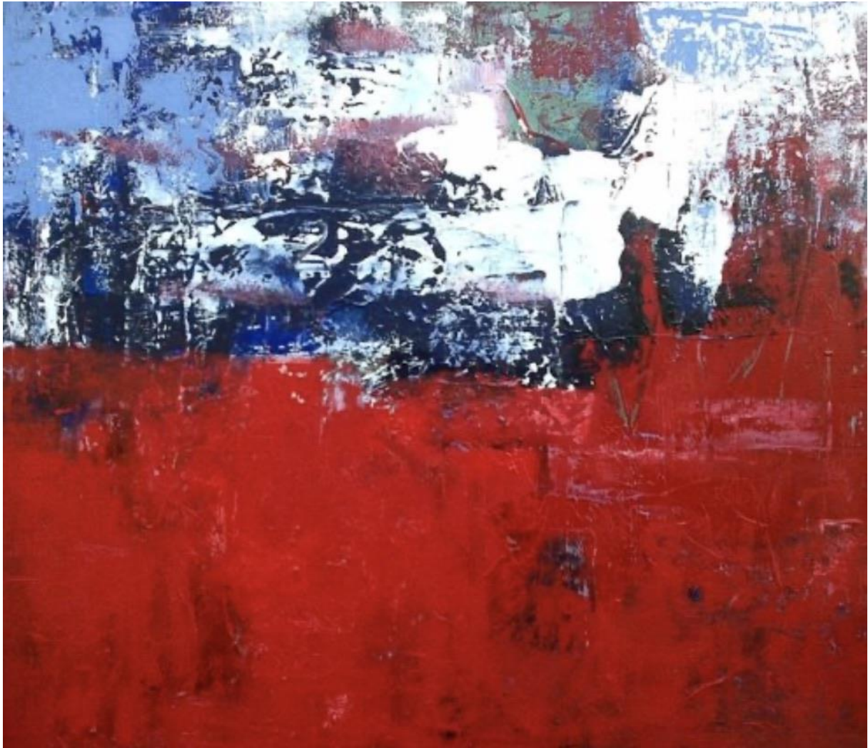
We Weten Veel En Veel Te Weinig – 2012 acryl op doek