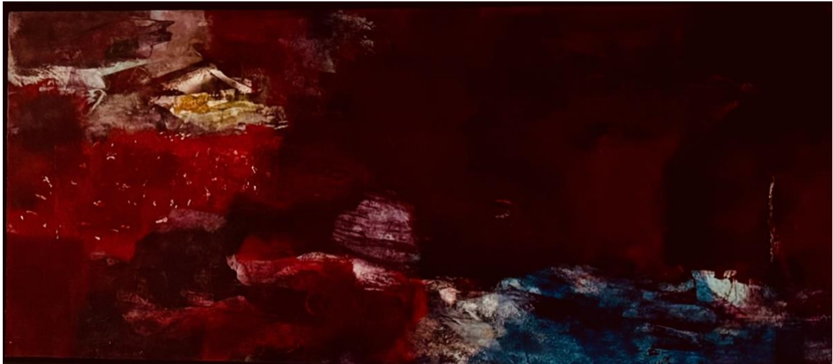
A Touch of Cinnabar – 2020 acryl en tempera op doek